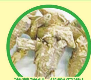
滋養強壮・代謝促進! 蝦夷五味加(エゾウコギ) ウコギ科の植物で根皮を乾燥させたもの。