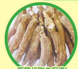
新陳代謝の促進! 紅参(コウジン) オタネニンジンの根を蒸し上げ乾燥させたもの。