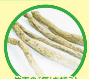
体表の「気」を補う! 黄耆(オウギ) 黄耆の耆は老人や年長の意味で重要なものであることに由来。

若甦温はお湯に溶かして飲むタイプの滋養強壮保健薬です。3種の生薬と6種のビタミンを配合し、体を温めて代謝を高めるので病気になりにくい健康な体づくりに役立ちます。冷えや疲れはもちろん、リラクセスの神経を高めるので、イライラやそれに伴う睡眠の不調などにもおすすめです。